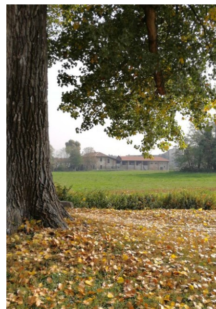
San Martino di Tours, la rete dei Punti Parco del Parco Agricolo Sud Milano ed un'immagine autunnale di Cascina Linterno vista dal Parco delle Cave

Autobus 67 (M1 - Bande Nere), 63 (M1 - Bisceglie), 78 (M1 - Bisceglie e M5 - San Siro), 49 (M1 - Inganni e M5 - San Siro)