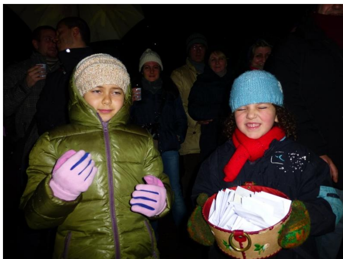
Vengono bruciati i biglietti con i “pensierini