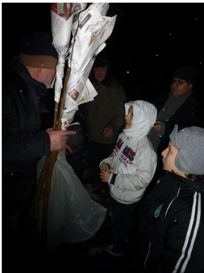
Le ultime istruzioni per l'accensione del Falò