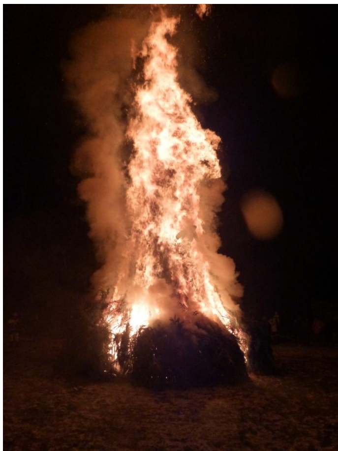
Fiamme immediate e spettacolari, alte addirittura una ventina di metri!