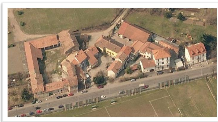
L'Antico Borgo di Linterno – Via Flli Zoia 182, 184, 186, 190 e 194