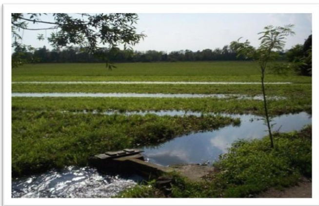
Milano – Il Parco delle Cave, Cascina Linterno e la Storica Marcita