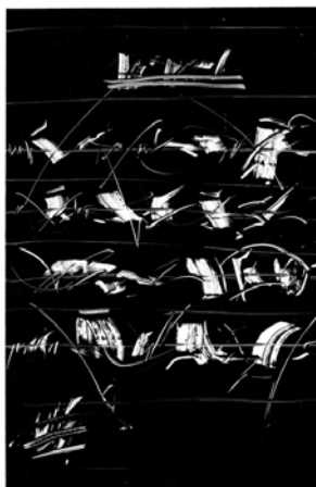
Eracle Dartizio , "Primary school", stampa su acetato