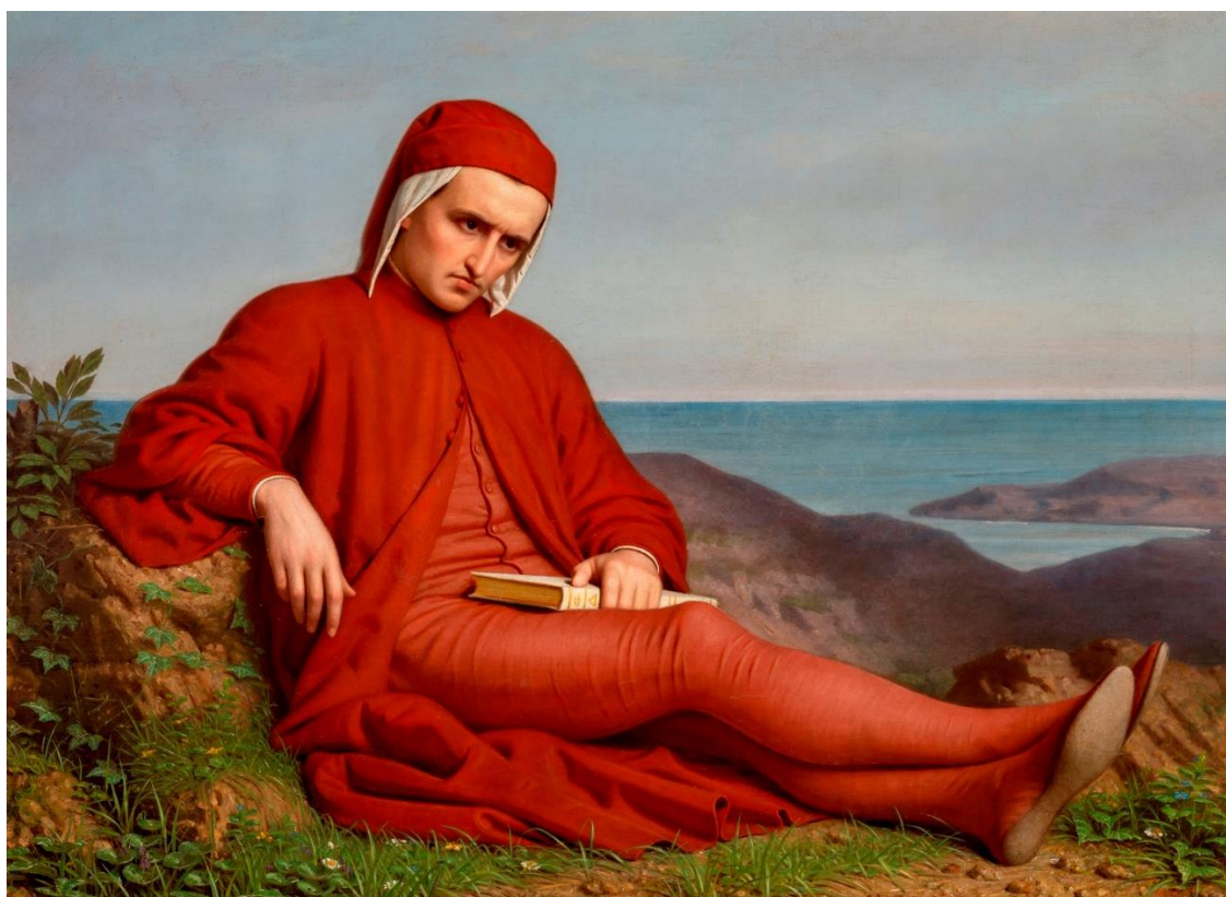
"Dante in esilio", Domenico Petterlin, Pinacoteca di palazzo Chiericati (VI)

Aia e Porticato delle Colonne di Cascina Linterno - Via F.lli Zoia, 194 - Parco delle Cave - 20152 - Milano