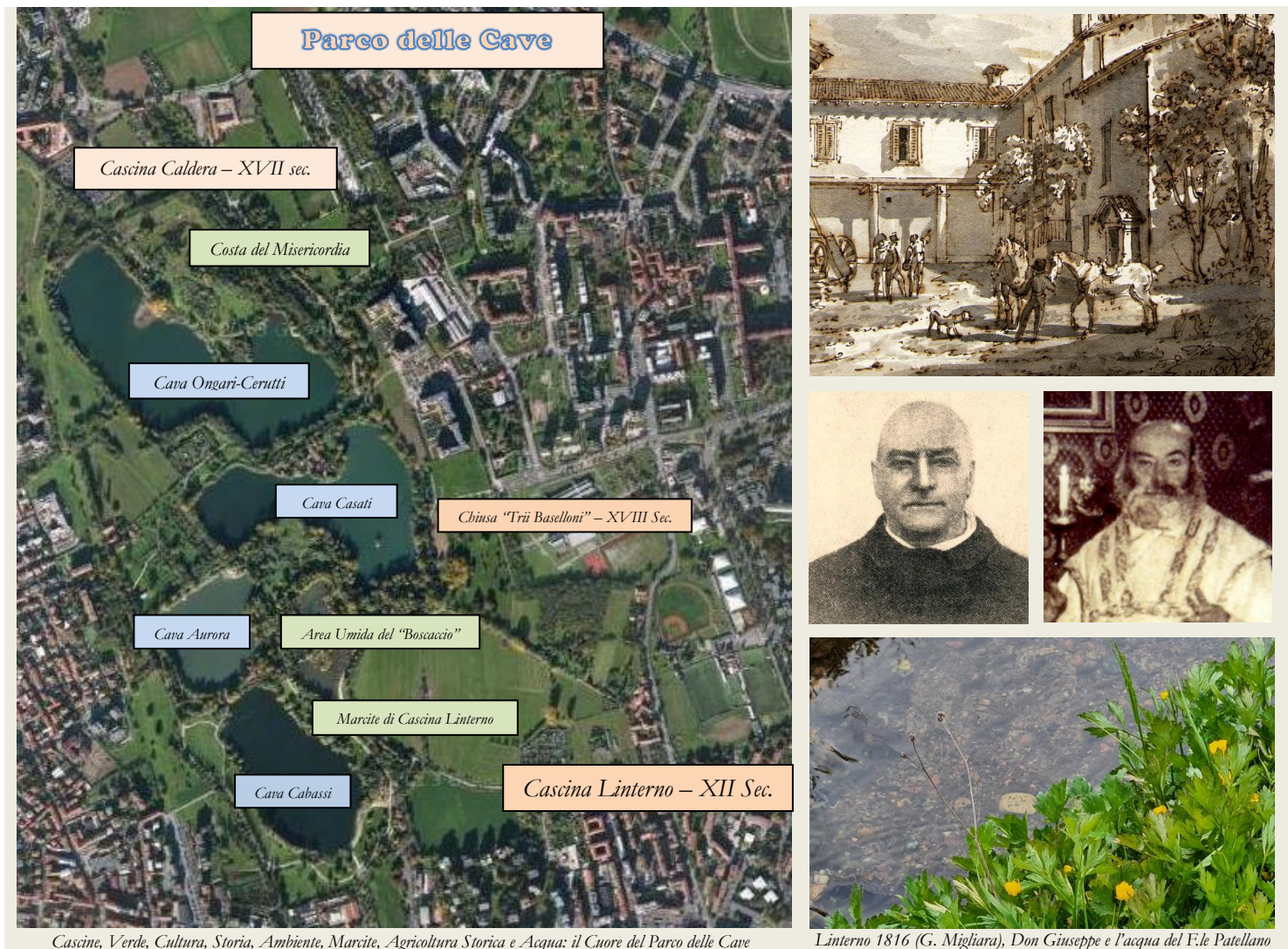
Cascine, Verde, Cultura, Storia, Ambiente, Marcite, Agricoltura Storica e Acqua: il Cuore del Parco delle Cave

Appuntamento presso la Chiesetta di Cascina Linterno - Ore 10 - Via F.lli Zoia, 194 - Parco delle Cave - Milano